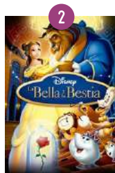
Setmana 2, del 4 al 8 de juliol: LA BELLA I LA BÈSTIA