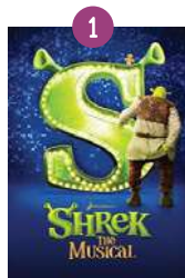
Setmana 1, del 27 de juny a l'1 de juliol: SHRECK

Tots els divendres a les 12h es podrà veure l'obra a l'auditori de l'escola o es transmetrà en directe a través d'Instagram.