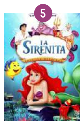
Setmana 5 del 25 al 29 de juliol: LA SIRENITA