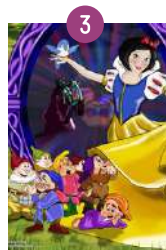
Setmana 3, de l'11 al 15 de juliol: BLANCANEUS I ELS 7 NANS