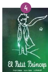
Setmana 4, del 18 al 22 de juliol: EL PETIT PRÍncep